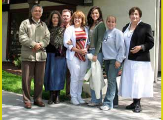
Alumnos del Seminario del Niño Interior

Además, todos los alumnos tendrán una plataforma teórica de las leyes universales, espirituales y sociales que ahora nos atañen para un entendimiento mejor del entorno.