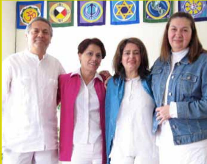
Alumnos del curso de Meditación